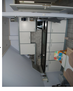
Sonnen-Balkon 6,80 m